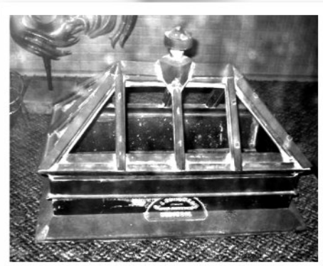
Un puits de lumière fabriqué par l'entreprise il y a 90 ans.